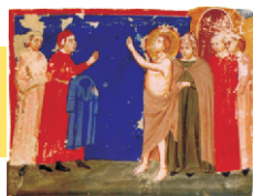
Šv. Pranciškus išsižada savo žemiškojo tėvo, atiduodamas ir rūbus